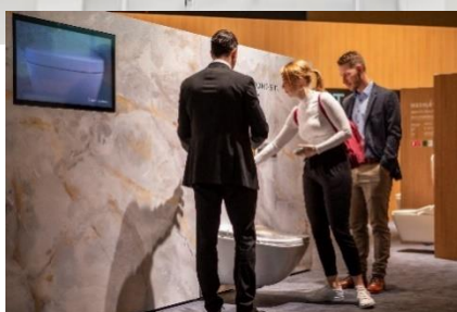
NEOREST WX 展示