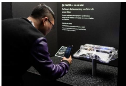
テクノロジー展示