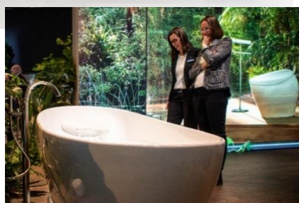
NEOREST NX コレクションズ