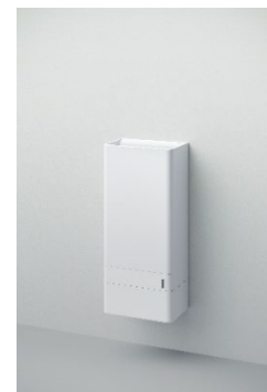
本体構造イメージ図

今回の受賞商品である「クリーンドライ(吸引・高速両面タイプ)」は、風・水滴を吸い込む吸引式を採用し、風の吹き返しや水滴飛散を抑え、より安心・快適にお使いいただけるよう設計しました。加えて、飛沫などの微細な粒子を捕集するHEPAフィルターを搭載しています。吸引した風をHEPAフィルターで浄化し、より清潔な風で手を乾かすことができます。ペーパータオル使用時のゴミ処理負担の削減や環境保護にもつながります。