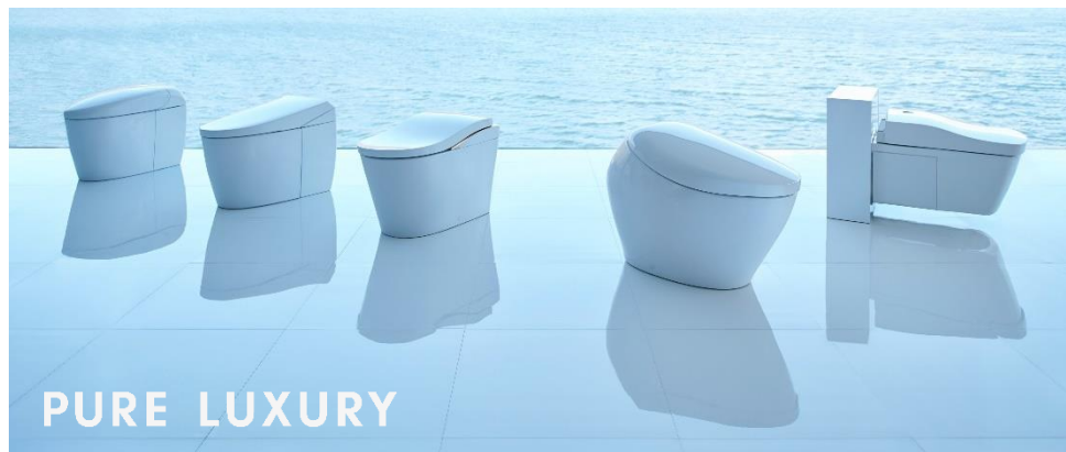
最新のネオレストシリーズ

誕生から30年。NEORESTはレストルーム界のパイオニアとしてのプライドと使命感を持ち、これまで以上に美しく大きな波紋となって世界のレストルームに快適の輪を広げていきます。