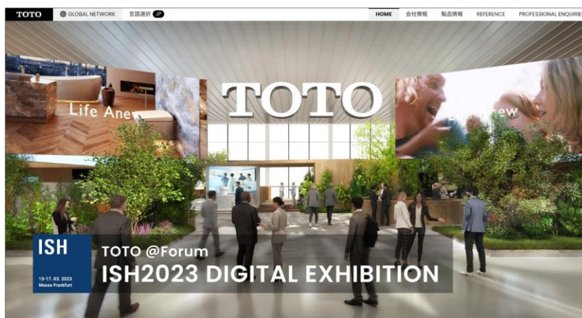
TOTOグローバルサイト「ISH展示会ページ」バナー