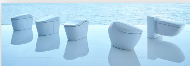
ネオレストシリーズ (左より ネオレストRS, AS, LS, NX, WX)

ネオレストがもたらす上質なライフスタイル、 生活に生まれる活力や豊かな時間、 ネオレストの世界観を表現した ブランドメッセージです。